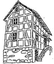
HAHN'SCHES HAUS SELTENSTRASSE 8 NEUENBRUNSLAR

Als die Pfadfinder von der Stadt Felsberg das Angebot erhielten, ein kleines Hirtenhaus im Ortskern von Neuenbrunslar zu erwerben, fanden sich ehemalige Pfadfinder, aktive Pfadfinder und Pfadfindereltern zusammen