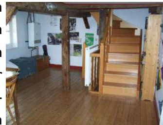
Spieltage mit Treppe zum Schlafboden

Direkt unter dem Dach befindet sich schließlich ein Matratzenlager zum Übernachten. Es gibt hier keine separaten Räumlichkeiten für Mädchen und Jungen.